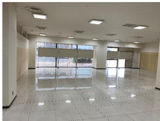
津センターパレス1階（薬局跡地）